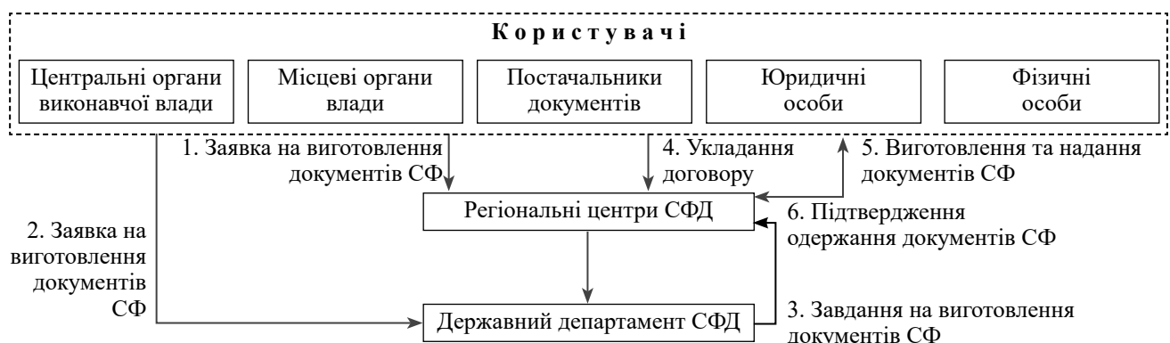
Рис. 4. Порядок забезпечення користувачів документами страхового фонду

З метою виконання Міністерством оборони України функцій щодо створення, формування і ведення СФД мобілізаційного та оборонного призначення необхідно виконати низку заходів. Зокрема, дотримання у Міністерстві оборони України законодавства України у сфері формування та ведення СФД можливо за умови вирішення наступних питань.