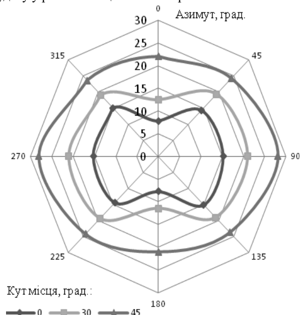
Рис.1. Значення видимої площі S_k на прикладі танка M1A2 Abrams в залежності від кутів спостереження.

Значення видимої площі цілі S_k залежить від типу цілі (ТАНК, БМП, БТР, САУ, автомобіль та інші), її повздовжнього і поперечного нахилу на місцевості та кутів спостереження. Дослідження 3D моделей наземних та рухомих цілей під різними кутами спостереження та виміри площі видимої поверхні за допомогою інструменту AutoCAD показали, що кожна з типових цілей для танка володіє певними характерними ознаками, які суттєво впливають на процес визначення видимої площі і у свою чергу є слабо структурованими на шляху до алгоритмізації процесу. Поряд з тим, аналіз отриманих залежностей доводить існування закономірностей у пропорційних значеннях видимих площ в залежності від кутів спостереження (рис. 1). Очевидно, такі закономірності властиві усім типовим цілям для танка з огляду на їх симетричну будову у різних площинах спостереження.